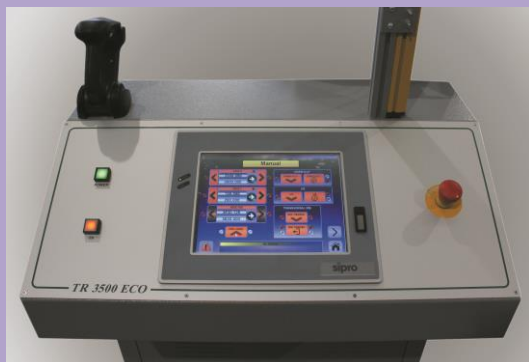
Consolle di comandi