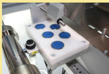
RILEVATORE DIFETTI (OPTIONAL)