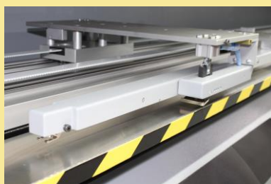
BRACCIO PRESA TESSUTO