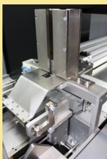
CARICATORE PESI (OPTIONAL)