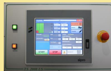
PAGINA INSERIMENTO DATI