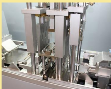
GRUPPO SALDANTE UTRASUONI